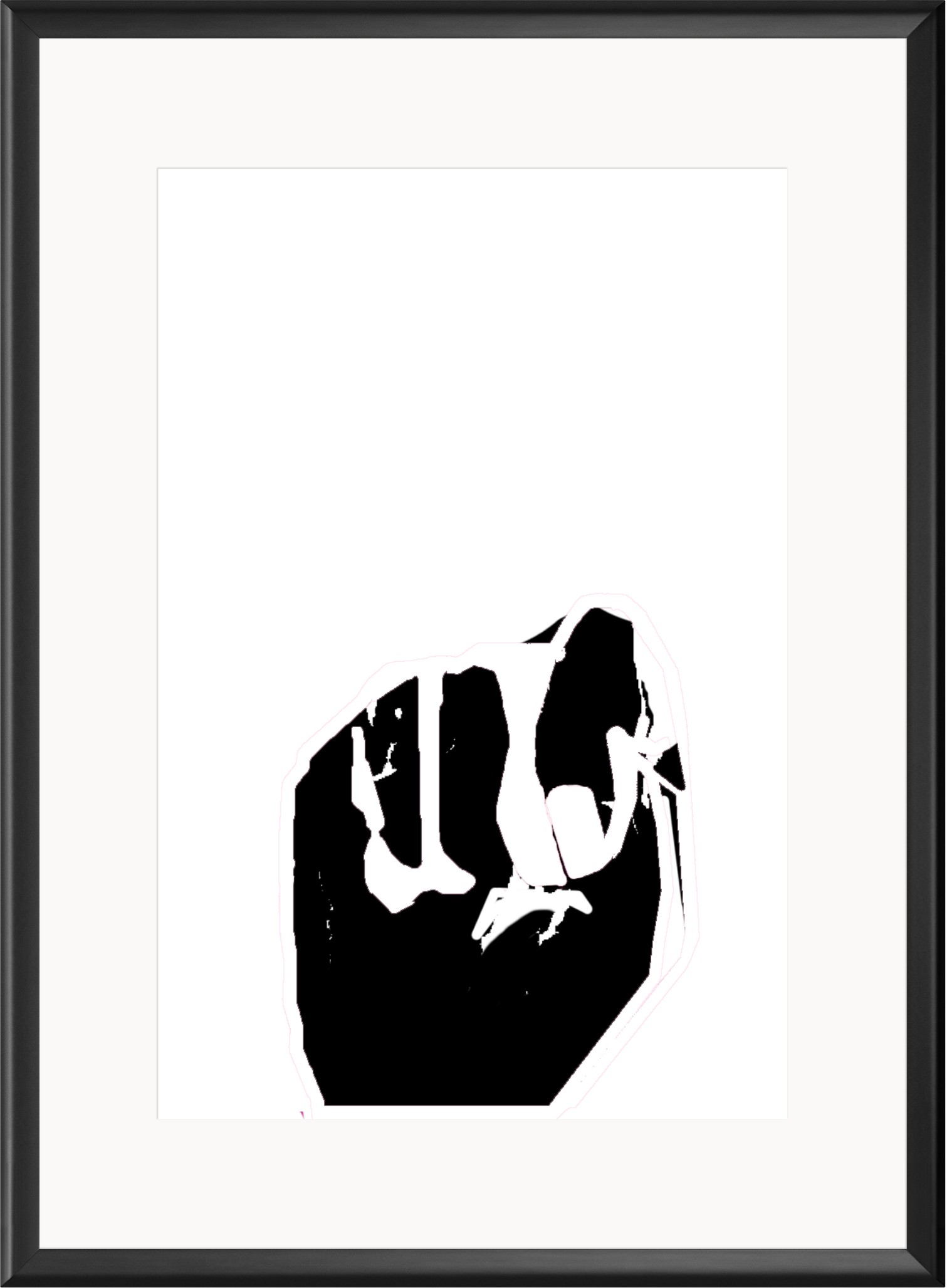
FIST La troisième étape